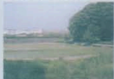
猪高緑地の田園風景