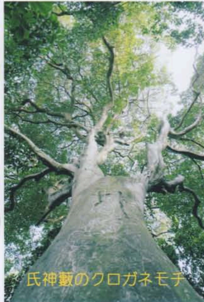
氏神藪のクロガネモチ